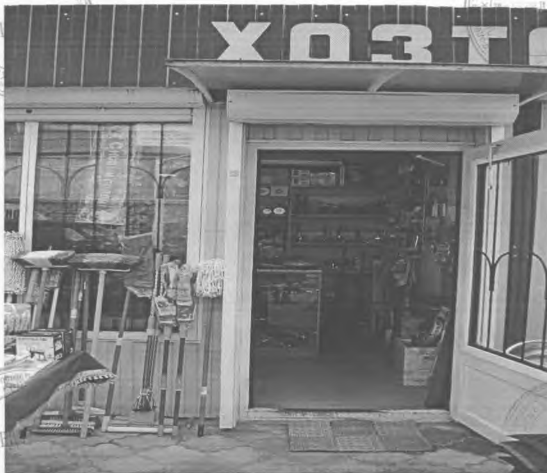
Фотоснимок № 1

земельный участок, расположенный по адресу: Волгоградская область, г. Котельниково, примерно в 10 м по направлению на восток от ориентира – здание, расположенного за пределами участка, адрес ориентира: ул. Ленина 3 (адрес земельного участка)